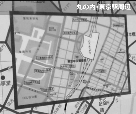
丸の内・東京駅周辺