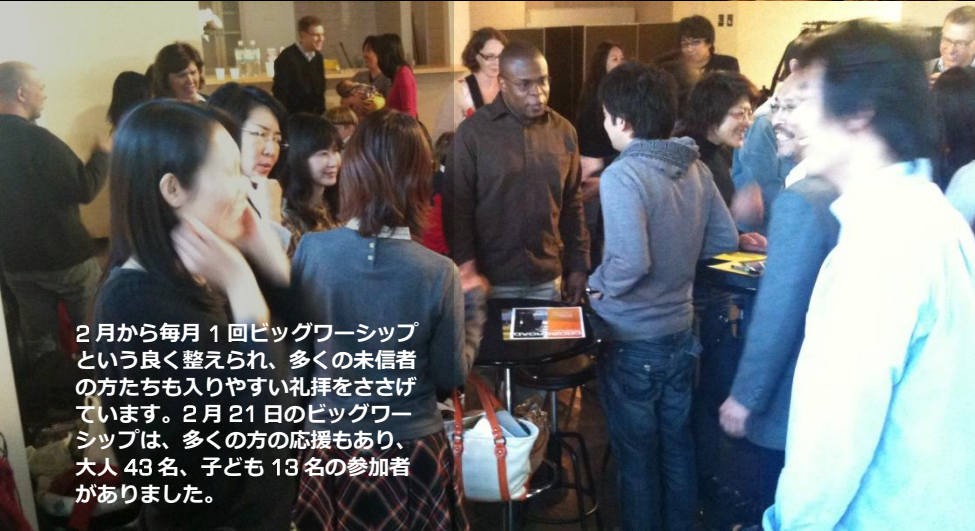
2月から毎月1回ビッグワshipという良く整えられ、多くの未信者の方たちも入りやすい礼拝をささげています。2月21日のビッグワshipは、多くの方の応援もあり、大人43名、子ども13名の参加者がありました。